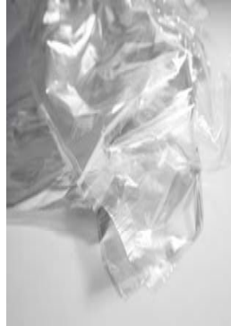
Todo tipo de films