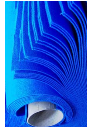
Alfombras, moquetas, tejidos