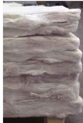
Láminas de Poliéster