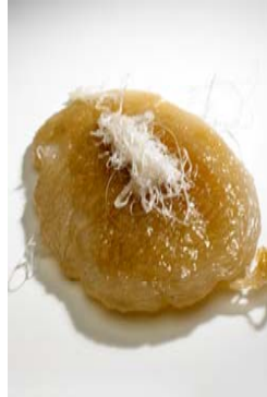
Sólidos, Mazacotas de puesta en marcha