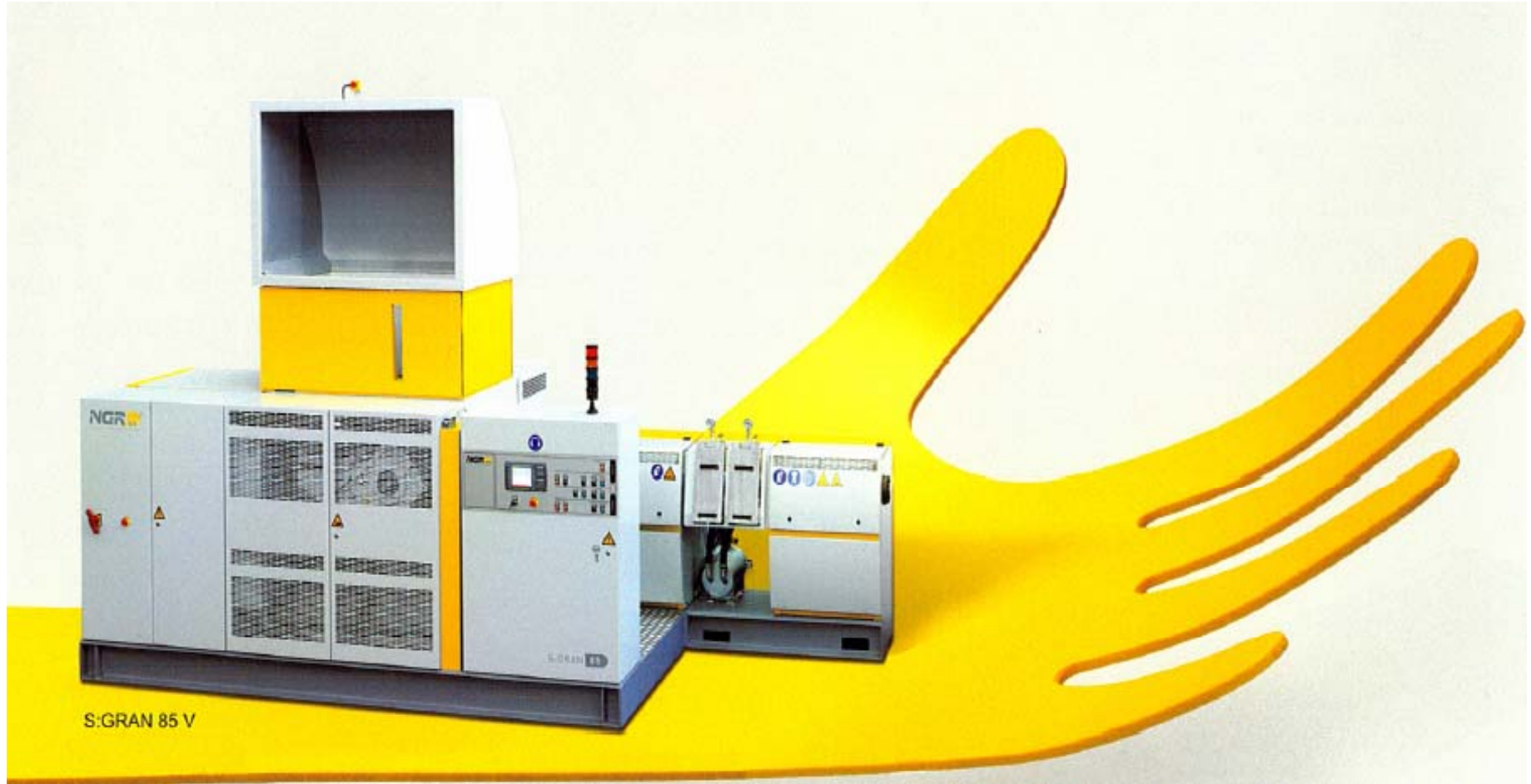
S:GRAN 85 V