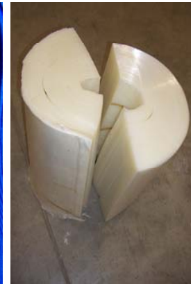
Bobinas de film