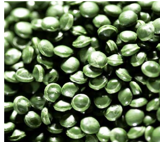
HDPE césped artificial