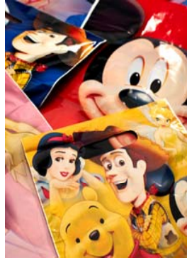
Films con elevado % de impresión